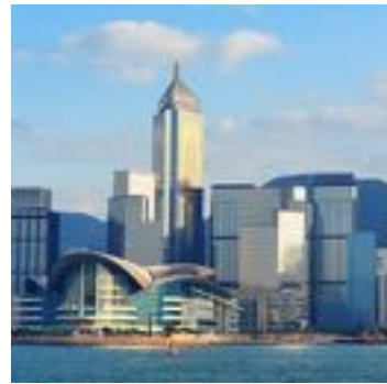
Büro | Hongkong