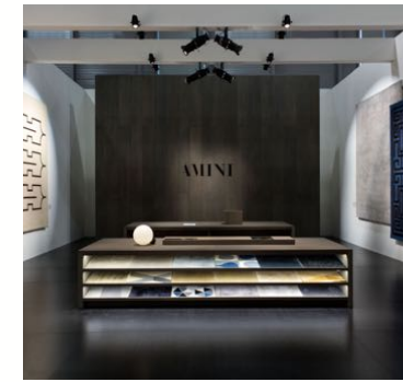
Showroom | Mailand