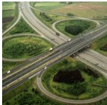
Hauptsitz | Kamen

Mit unserer Standortstruktur haben wir den Rahmen für die optimale Funktion unserer Leistungsprozesse geschaffen.